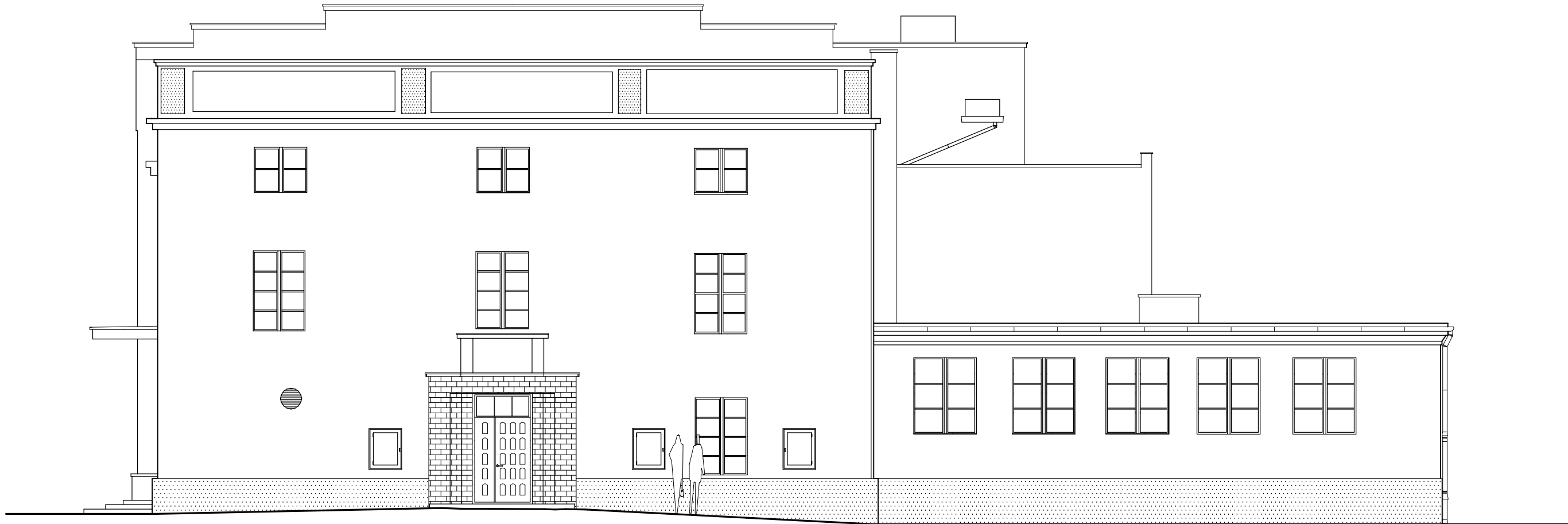
ELEWACJA OD UL. WOLA ZAMKOWA